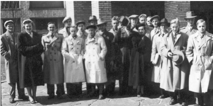
Luokkaretkellä keväällä 1952 upouuden Kauppakorkean edessä, josta tuli sittemmin "kohtaloni". Seison liian isossa poplarissani äärimmäisenä oikealla.